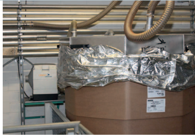
Bild 5. Um dem Rückfeuchten des Materials im Oktabin zu begegnen ist der Behälter abgedeckt. Zudem wird sein Inhalt permanent mit Trockenluft beschleiert

peraturen die Trockenzeit. Für eine technisch und wirtschaftlich zweckmäßige Anlagenauslegung mit konstanten Trocknungsparametern war daher eine Beschränkung der zulässigen Anfangsfeuchte unabdingbar.