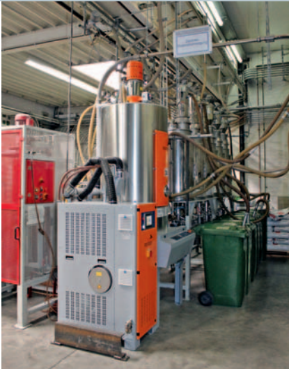
Bild 4. Ausgerüstet mit einer automatischen Temperatur- und Taupunkt-Nivellierung (ATTN) regelt der Trockenlufterzeuger Luxor A 120 den Taupunkt der Prozessvorluft mit einer Genauigkeit von \pm 1^\circ\text{C}

Kombination aus Taupunkt- und Trocknungstemperatur zu ermitteln, wofür im Tech Center bei Motan-Colortronic umfangreiche Trocknungsversuche mit zahlreichen Feuchtigkeitsmessungen durchgeführt wurden.