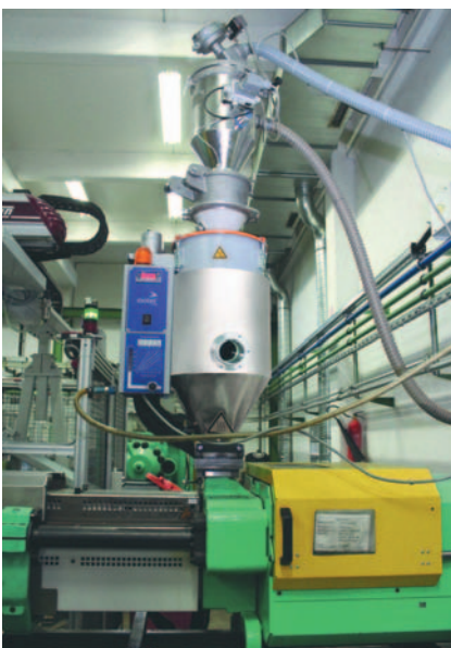
Bild 6. Sicherheitshalber hat Hillers auf den Maschinen zuschaltbare Aufsatz Trockner installiert, um das Rückfeuchten des Granulats in der Materialvorlage zu verhindern

Grundsätzlich ist solch ein Gleichgewichtszustand bei unterschiedlichen Parameterkombinationen möglich. Um jedoch bei langen Verweilzeiten im Trockentrichter eine thermische Schädigung des Materials zu vermeiden, ist eine Kombination aus niedrigen Trockentemperaturen und besseren (tieferen) Taupunkten ratsam. Zwangsläufig verlängert sich bei niedrigen Trockentem-